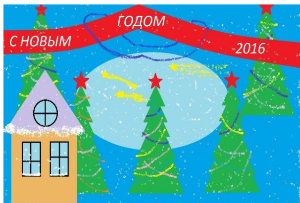
Рисунок Слепко Ивана, 8Б