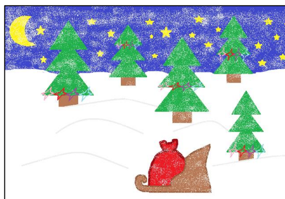
Рисунок Трескиной Екатерины, 8Б