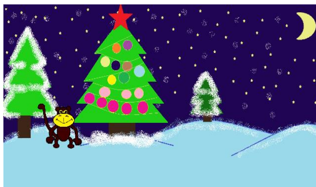
Рисунок Тюпышевой Алисы, 8А