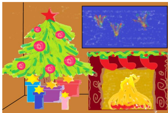
Рисунок Анисимовой Виктории, 8В