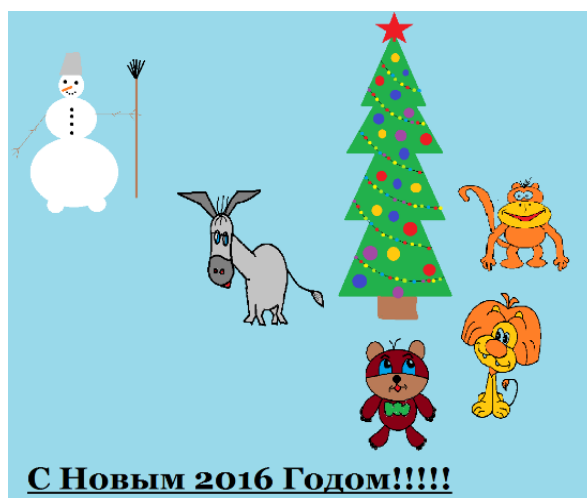
Рисунок Потанина Дмитрия, 8А