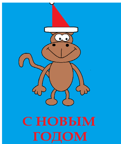
Рисунок Мазилова Никиты, 8В