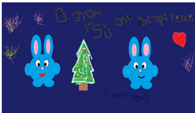
Рисунок Щербаковой Виктории, 8А