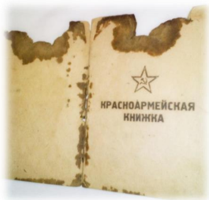
Эта красноармейская книжка была при дедушке, когда в него попала пуля снайпера.

В декабре 1941 года мой прадедушка участвовал в боях за Тихвин и был награждён медалью «За боевые заслуги». Эта медаль в 1944 году спасла прадедушке жизнь. Когда он отправился на очередное задание, снайперская пуля попала ему прямо в грудь, в то место, где была медаль. Но, благодаря медали, траектория пули изменилась, и она прошла на два миллиметра ниже сердца. Прадед выжил, но получил тяжёлое ранение. Пуля прострелила легкое насквозь. Это случилось 2 марта 1945 года в Польше.