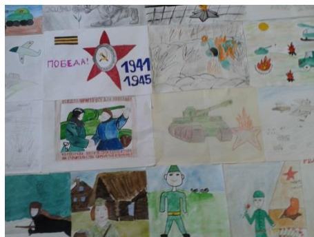
Выставка рисунков, посвященная Победе в Великой Отечественной войне, в фойе 1 этажа