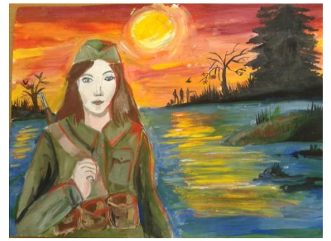
Рисунок Викуловой Анны, 9А класс