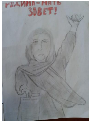
Рисунок Дегтяревой Дарьи, 7Б класс