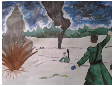
Рисунок Овсянниковой Дарьи, 5А класс