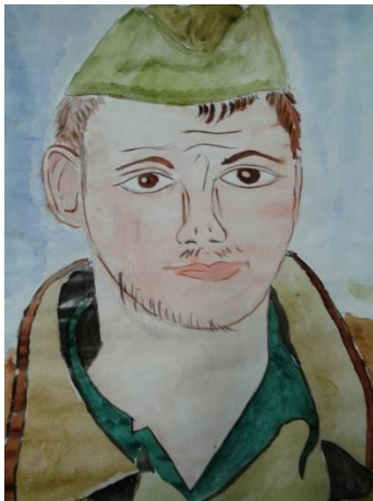
Рисунок Попова Дмитрия 8А класс