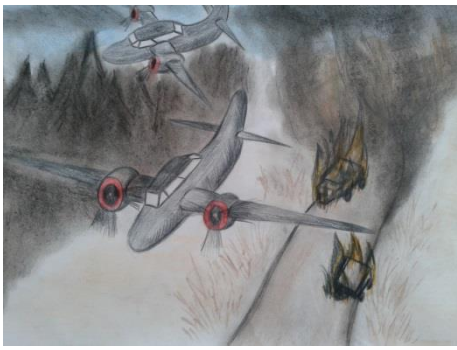
Рисунок Смирновой Мирославы, 7В класс