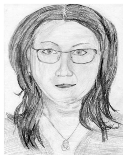
Рисунок Лопатиной Снежаны, 9А клас