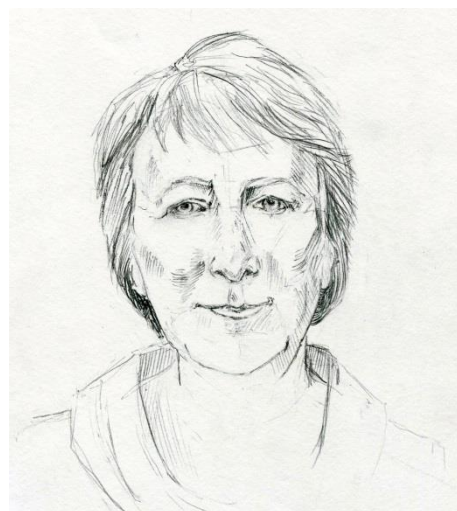
Рисунок Каль Ульяны, 9А класс