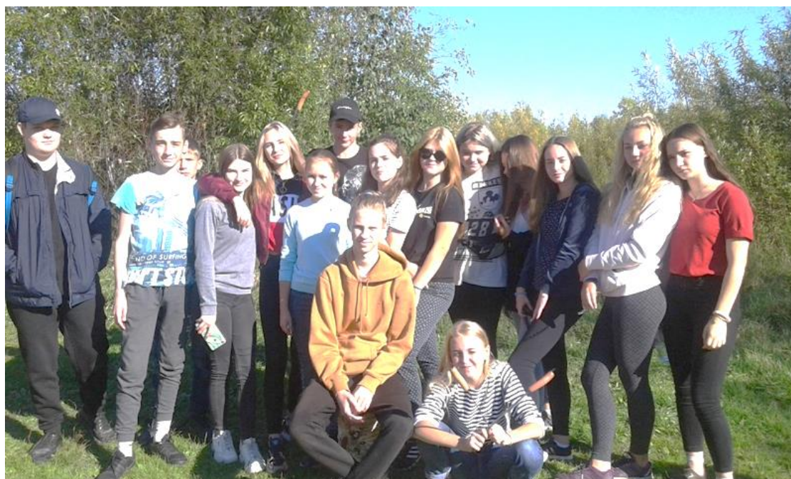
Команда 9А класса – победители туристических конкурсов