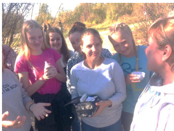
Команда 8В класса – станция «Медицинская»