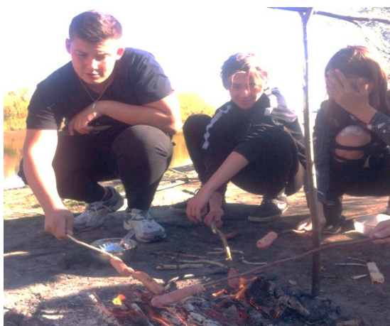
Команда 9Б класса – приготовление обеда

Подобные мероприятия способствуют улучшению взаимопонимания между одноклассниками, поднятию настроения, позволяют узнать много нового и интересного.