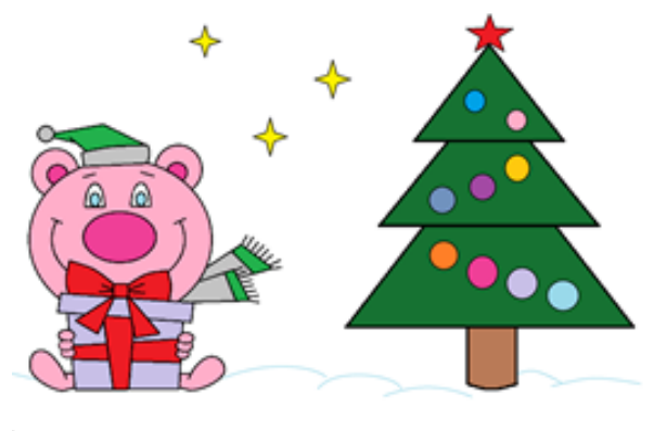
Рисунок Овчинниковой Анастасии, 8А класс