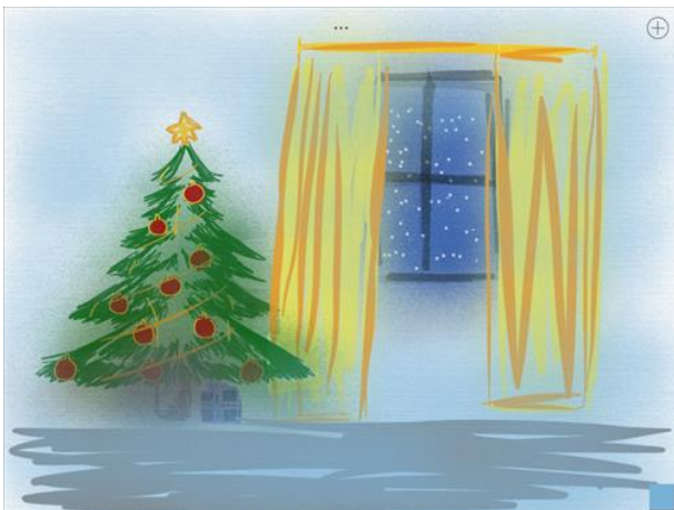
Рисунок Назарук Ирины, 8А класс