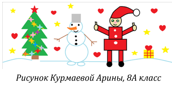
Рисунок Курмаевой Арины, 8А класс