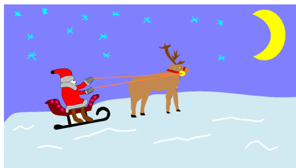
Рисунок Шевелева Артема, 8А класс