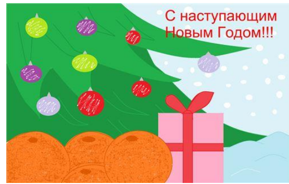
Рисунок Быковой Марины, 8А класс